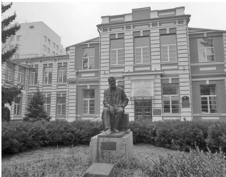
Рис. 7. Пам'ятник Ф.Г. Яновському біля Національного наукового центру фтизіатрії, пульмонології та алергології ім. Ф.Г. Яновського НАМН України

«Не знаю. Щось не ладно все. Життя стає мені не під силу. Повсюди нещастя й горе. Нема на чому оку відпочити. Нема почуття радості від життя. Вам, молодим, це легше, а мені не під силу стає», – писав він тоді [11]. Утім, продовжує працювати.