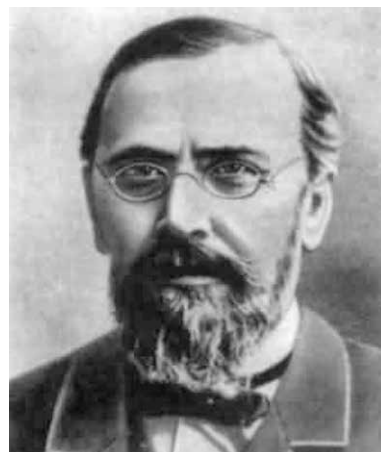
Рис. 3. Професор Г.М. Мінх

У госпітальній терапевтичній клініці розпочав він наукову діяльність. У 1884 році опублікував своє перше