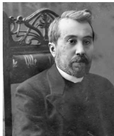
Рис. 4. Ф.Г. Яновський

У 1888-1889 роках пише низку інших цікавих і дуже корисних для киян праць: «Бактеріологічне дослідження Дніпровської води в Києві», «Бактеріологічне дослідження снігу», «Діагностична цінність дослідження крові на наявність