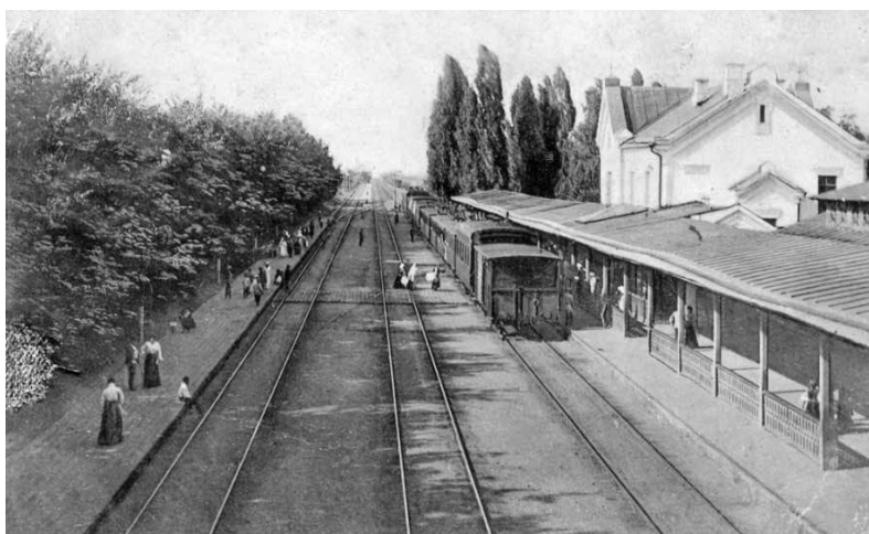
Рис. 5. Залізнична станція курортного містечка Боярка. Початок ХХ століття. Старовинна поштівка

Бальнеологічна тематика його взагалі дуже цікавила: відпочиваючи на курортах, він безоплатно працював, забуваючи про відновлення власного здоров'я. Наприклад, проводячи відпустку в м. Кранце, він щоранку їздив